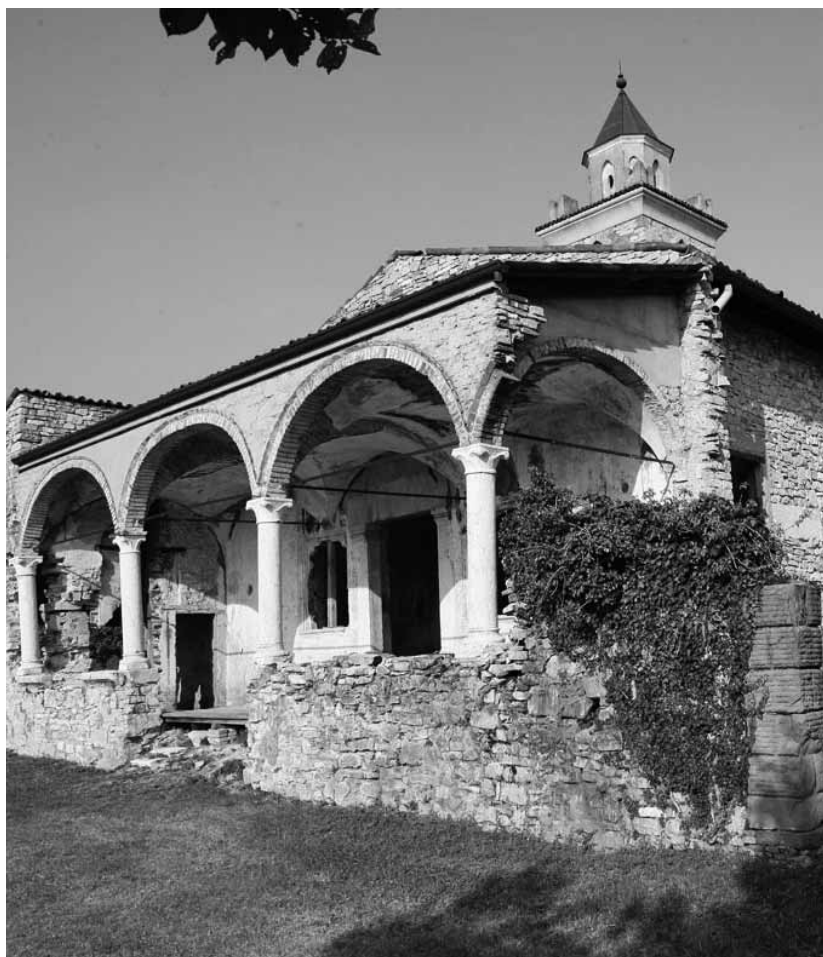
Il restauro è urgente per ovviare al degrado della storica struttura

Nel 1479 una bolla di papa Sisto IV affidò la chiesa ai Domenicani di Brescia, i quali la restaurano e vi costruiscono accanto il convento e locali per i contadini. Il monastero assicura l'assistenza religiosa nella zona e funziona, per più di tre secoli, da centro di rifornimento di prodotti agricoli (vite, ulivo, frutta, erbe officinali).